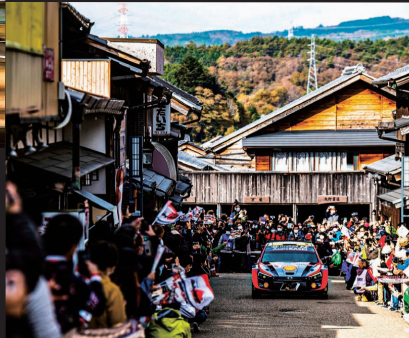
写真: 勝田貴元 / アーロン・ジョンストン組 (トヨタGRヤリス・ラリー1) ©TOYOTA オット・タナク / マルティン・ヤルヴェオヤ組 (ヒョンデi20 Nラリー1) ©Jaanus Ree / Red Bull Content Pool

2023年はラリー1規定による“ハイブリッド時代”の2年目を迎え、全13戦を予定。ラリージャパンは再びシーズン最終戦として11月に開催される。